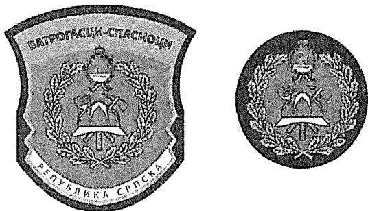
Слика 21: Амблем

Амблем је израђен у следећим бојама: црвена, плава, бијела и златножута.